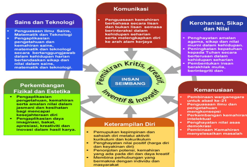
Rajah 1 Kerangka Kurikulum Standard Sekolah Menengah

Kurikulum Standard Sekolah Menengah (KSSM) dibina berasaskan enam tunjang, iaitu Komunikasi; Kerohanian, Sikap dan Nilai; Kemanusiaan; Keterampilan Diri; Perkembangan Fizikal dan Estetika; serta Sains dan Teknologi. Enam tunjang tersebut merupakan domain utama yang menyokong antara satu sama lain dan disepadukan dengan pemikiran kritis, kreatif dan inovatif. Kesepaduan ini bertujuan membangunkan modal insan yang menghayati nilai-nilai murni berteraskan keagamaan, berpengetahuan, berketerampilan, berpemikiran kritis dan kreatif serta inovatif sebagaimana yang digambarkan dalam Rajah 1.