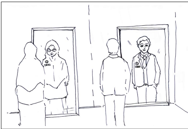
Menjaga Penampilan Diri